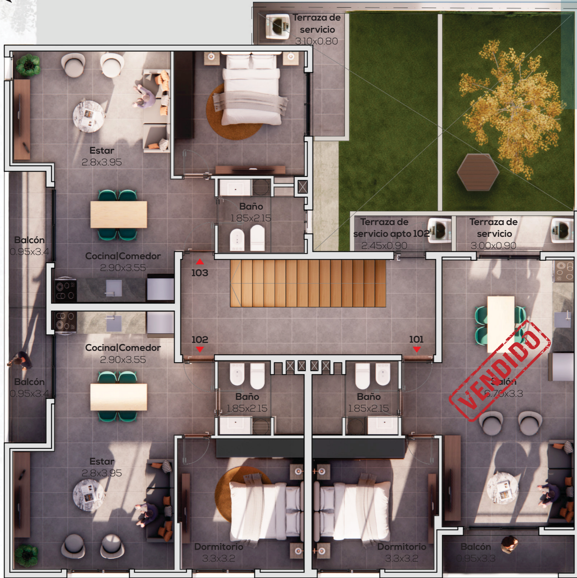
PLANTA PRIMER NIVEL

Apartamento 103 Un dormitorio Unidad_43.43m2 Terraza_7.25m2 Total 50.68m2