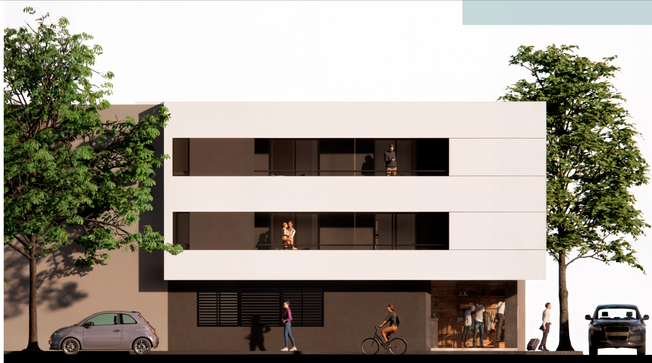
Fachada sobre calle Soca.