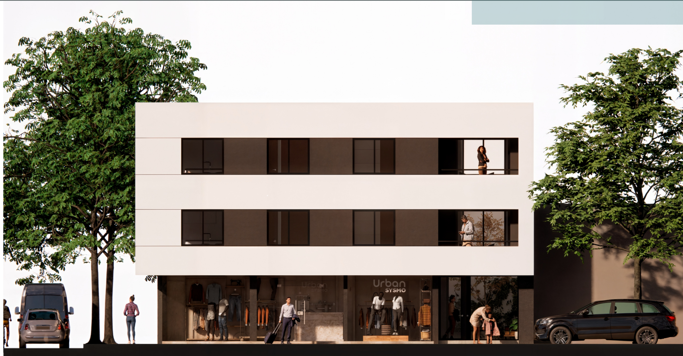
Fachada sobre calle 8 de Octubre.