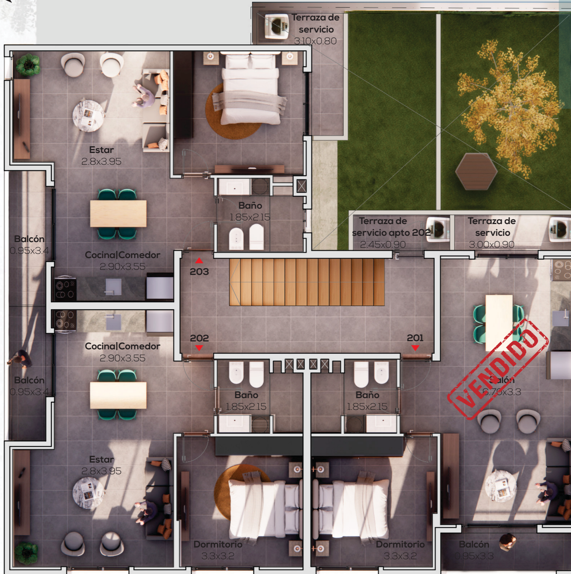
PLANTA SEGUNDO NIVEL